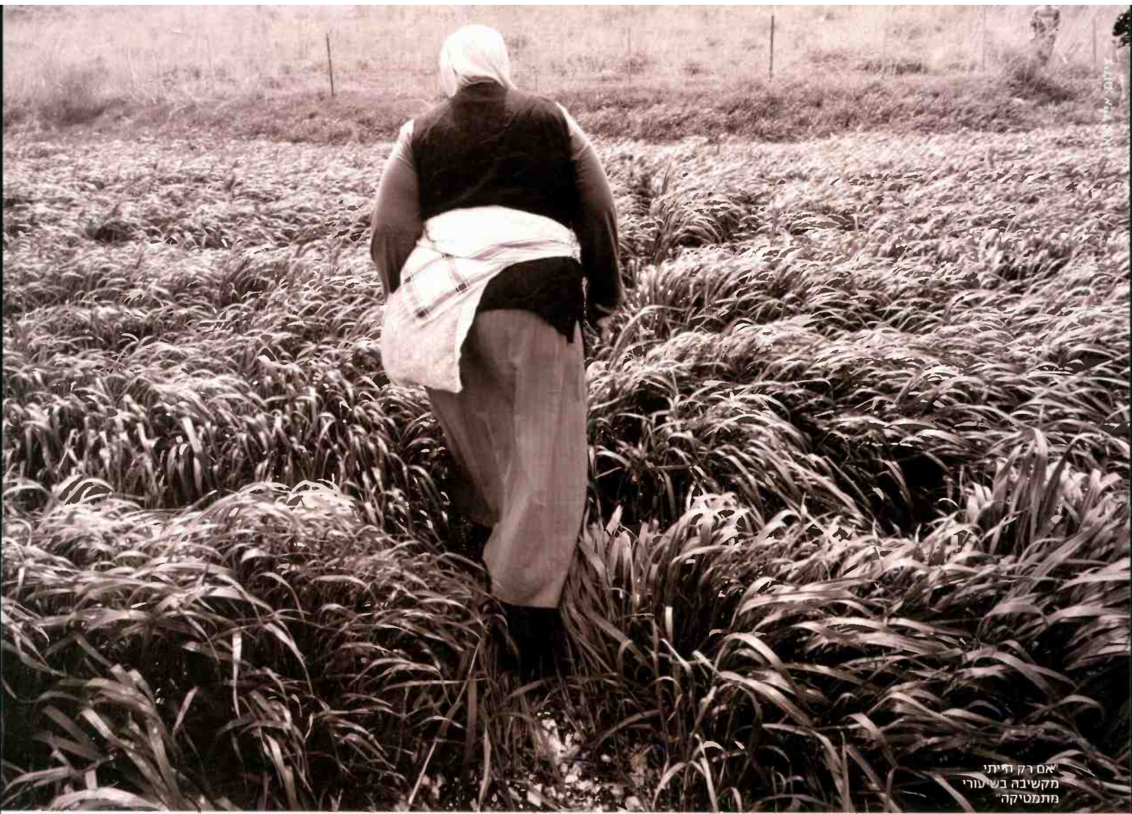
"אם רק הייתי מקשיבה בשערי מתמטיקה"